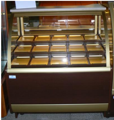
Lada pralinowa LP-95 S-3P