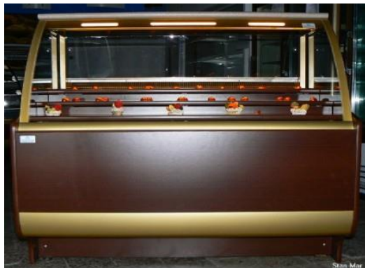
Lada pralinowa LP-135 S-3P