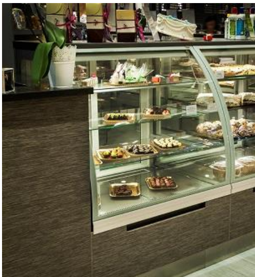
Lada cukiernicza LC-135 P/PM