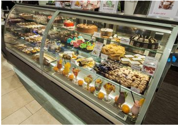
Lada cukiernicza LC-135 N/PM