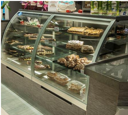
Lada cukiernicza LC-95 S/PM