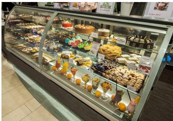
Lada cukiernicza LC-135 S/PM